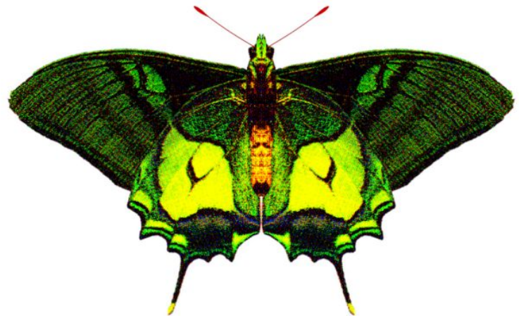
属 Teinopalpus 種小名 aureus 英名 和名 オウゴンテングアゲハ 分布 中国南部 開長 100mm UN 食草 未知

テングアゲハ属はテングアゲハとオウゴンテングアゲハの2種。中国南部の山岳地帯からヒマラヤの山麓に生息し、幼虫の食草はモクレン科。