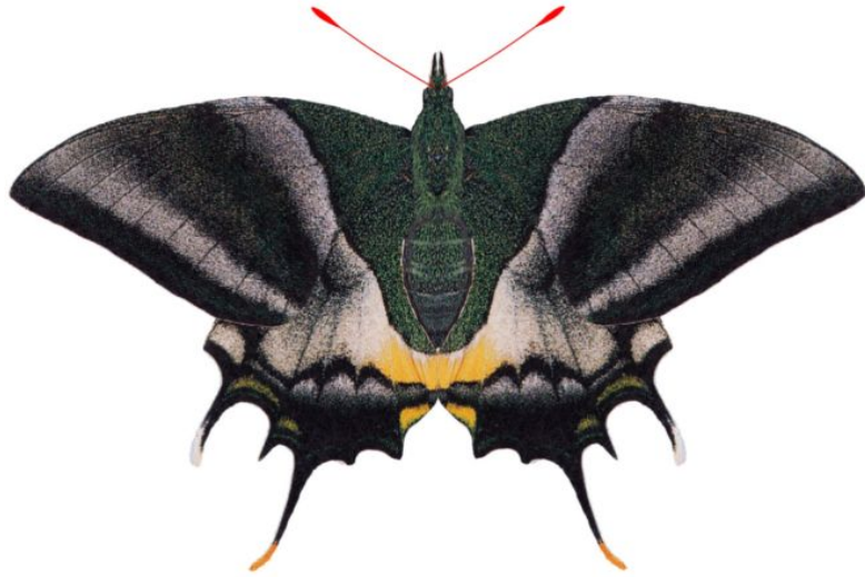
属 Teinopalpus 種小名 imperialis 英名 Kaizar-i-Hiind 和名 テングアゲハ 分布 ヒマラヤ～ベトナム 開長 110mm 食草 モクレン科(モクレン、ホオノキなど) 代表種ーモクレン